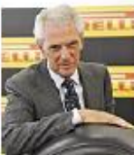
Medaglietta d'argento Marco Tronchetti Provera è alla guida di Pirelli & C.