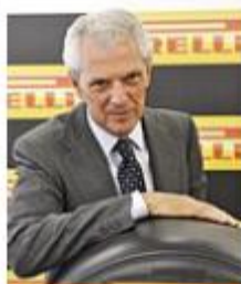
Medaglia d'argento Marco Tronchetti Provera è alla guida di Pirelli & C.